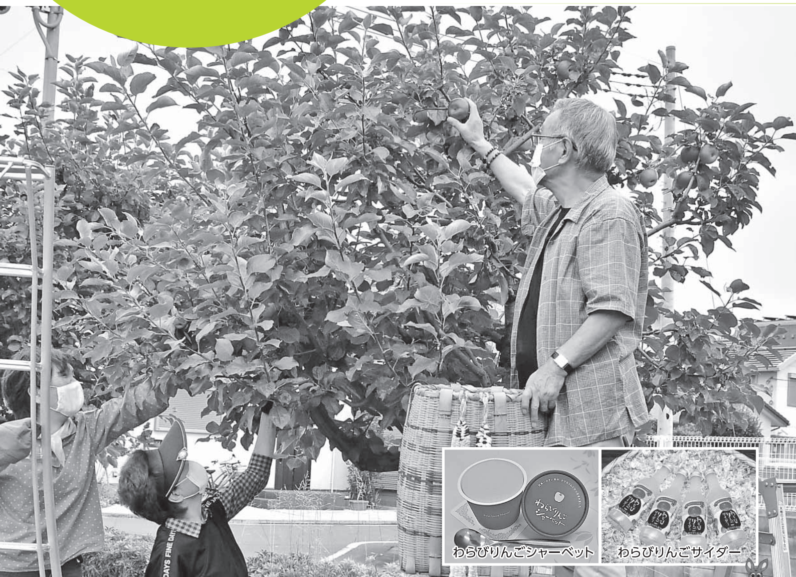
わらびりんごシャーベット