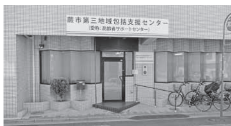
居場所づくり等でも役割が期待される（第三地域包括支援センター 塚越2丁目）