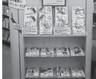
「さよなら私のクラマー」市立図書館の特設コーナー

総務部長 非正規での採用については考える余地がある。一方、就職氷河期世代に限らず、社会人経験者などの中途採用は、新しい血が入り組織の活性化につながる面もあるが、実施する考えは。