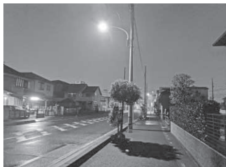
住宅街の道路照明灯。かわいらしい街路樹の下には濃い影。道路交通面でも防犯面でも危険。

三・世代間の対立を防ぐべしを掲げる。今日の我が国は、「老害」という言葉が生まれるほどに、世代間対立が激化してしまった。その理由は、①我が国が貧しい国になりつつある。②少子高齢化のスピードが早過ぎて、資源の再配分のバランスが急速に崩れてしまった。