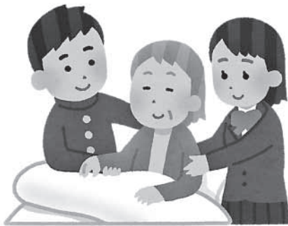
ヤングケアラーへの支援を

健康福祉部長 ヤングケアラーの問題は、障害や病気のある家族等への看護や介助、身の回りの世話をするため、家事や幼い兄弟の世話、家計を支えるための労働などにより