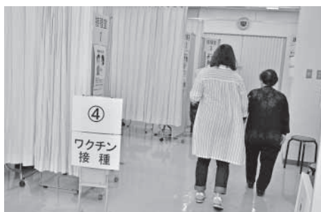
新型コロナウイルスワクチン集団接種会場 (保健センター)

3月議会では16・17・18日の 3日間で14人の議員が、市政に 対する一般質問を行いました。