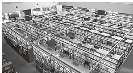
多くの人が利用する図書館。新たな整備への期待が広がる

議員 再開発で駅前に整備する図書館だが、子どもだけの利用という視点でデザインや内容など見直す必要はないか。例えば、時間貸駐輪場では児童は使いにくいがどうか。