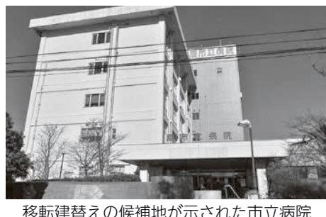
移転建替えの候補地が示された市立病院

行為の補正予算案を提案したが、その計画の中において、内部環境や外部環境などの調査を行い、そうしたデータ分析も併せて用いながら、診療の在り方など、経営の強化につながる立案・助言・指導をいただくことが重要であると考え、今回の基本構想及び基本計画の中に経営コンサルの要件も盛り込んでいる。 議員 市立病院の移転に伴う西公民館と松原会館の移転についてはどのようにするのか。 病院事務局長 市民の方からご寄附いただいた錦町丁目の土地に、両施設を複合施設として移転できる可能性があると判断し、今後課題点を整理しながら移転整備への検討を進めていくこととなる。 議員 多額の費用がかかる事業であり、将来負の遺産にならないようにする責任がある。経営状況の分析が重要であり、課題を共有しながら進めていく状況をつくっていただきたい。