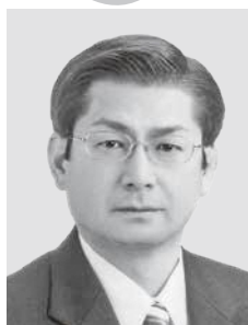
議長 長 幸一 大石

12月定例会では、12・13・14日の3日間で13人の議員が市政に対する一般質問を行いました。