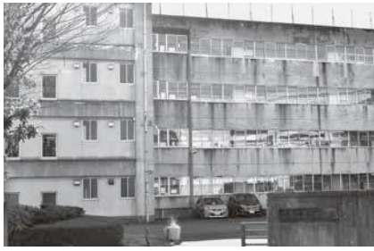
校舎の外壁改修が予定されている第二中学校

判断し、今年度、第二中学校校舎の外壁・屋上防水改修工事の設計委託を実施している。