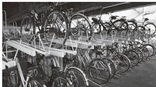
簡単に収納できる自転車ラックの導入を