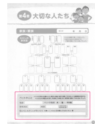
マイエンディングノートにはペットについて掲載されている

市長 トライアングル支援による連携は非常に大事である。保護者への支援や課題、提案を受けて、さらに充実した取り組みを行ってきたい。