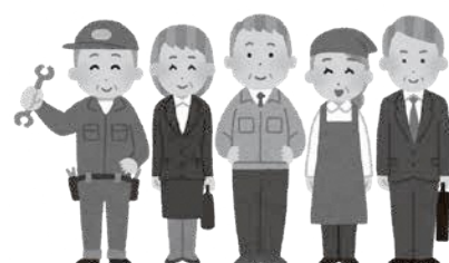
アクティブシニア層の地域貢献活動は自身の健康維持につながる