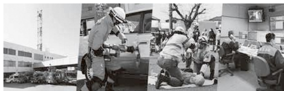
市民の安全・安心を守る消防本部

議員 桜の現状及び樹勢維持への対応、また桜並木を未来につなげるための対策はどのようなか。