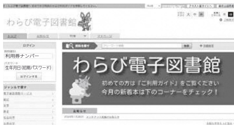
電子図書館の更なる充実を （わらび電子図書館 HP）