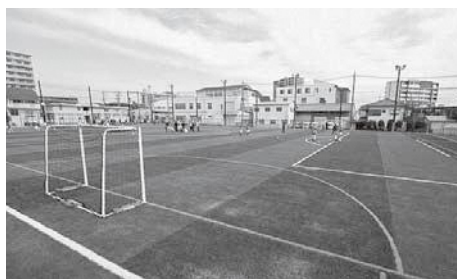
日陰がない錦町スポーツ広場に熱中症対策を

議員 フットサルやグラウンドゴルフなどで利用される人芝の錦町スポーツ広場は木陰等もなく、暑い日には逃げ場がないという利用団体の方