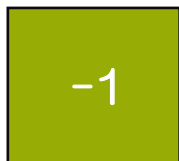
(補助番号プレート)