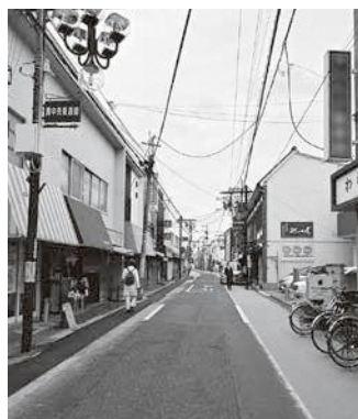
商店街への逆風は強いが蕨の商店街は絶対に変われる

ーション事業については、空き店舗有効活用事業補助金制度を設けているほか、空き店舗等の有効活用等の促進に関する協定を締結した。資金の融資や創業支援、また、空き店舗所有者に対し、店舗のリノベーションや創業希望者とのマッチング等、一連の管理を代行するサブリースの手法によって空き店舗の有効活用を図る等、にぎわいの創出と地域経済の活性化を推進するもので、本年1月には空き店舗等有効活用セミナーを開催した。経営体質の強化事業については、魅力ある店舗づくり支援事業補助金の活用と、蕨商工会議所の伴走型支援による経営体質の強化を図り、店舗周辺エリアのブランド力向上等にも取り組んでいる。