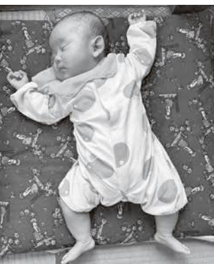
22世紀に向かって 君たちはどう生きるか

議員 若い世代が、結婚・出産・子育て期に市外に転出する傾向があると分析されているが、原因や対策はどのようなか。