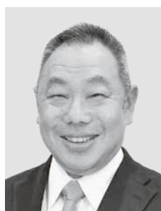
副議長 古川 歩