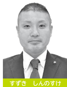
すずき しんのすけ