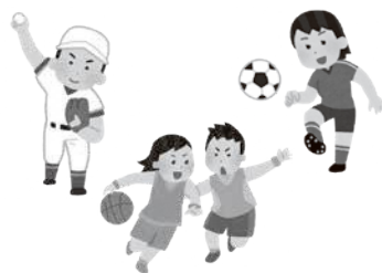
ボール遊びは子どもたちの健やかな成長につながる