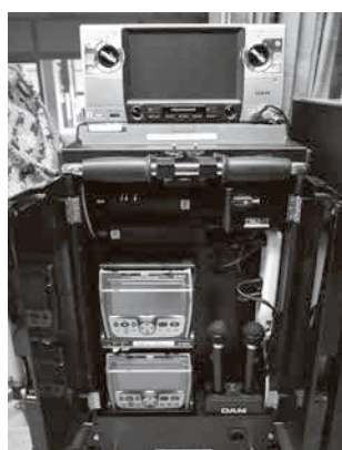
けやき荘にある通信カラオケは人気がある

議員 現状、多くの方が来ているとは感じられない。もっと多くの出会いがある仕組みづくりを。また、ボランティアポイントを導入している自治体もある。今後、検討を。