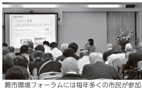
蕨市環境フォーラムには毎年多くの市民が参加

議員 現時点で深刻化している課題。相談窓口への住宅ソーシャルワーカーの配置や不動産業者団体への協力要請、公的保証人制度の具体化等、迅速な対応を要望する。