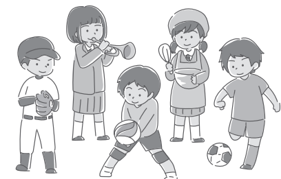
約130年続いた部活動は転換期を迎える