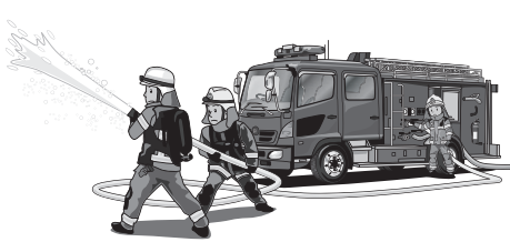
乾燥期の火災は大規模火災に至るおそれがあるため特に注意が必要