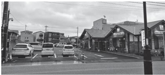
2月末にオープンした民間機能施設の向かい側に公共機能施設が整備される予定

市民生活部長 何を用意するかは今後の検討となるが、置いてあるものを自由に使用して遊んでいただくことは良いと考えている。