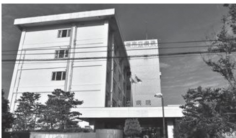
建替えと経営改革の検討が進む市立病院

市民生活部長 駅西口再開発により新たな集客拠点が形成されることに連動し、官民連携の整備事業で中山道エリアに新たなにぎわいを創出し、駅西口周辺と駅前通りを結びエリアの回遊性を高めて、ま