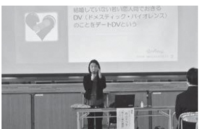
第一中学校で開催された「性と人権の講話」～生命（いのち）の安全教育～の様子

健康福祉部長 市ホームページや、公式LINE等を活用し、女性や若年層の方がより情報や相談につながりやすい環境を整備していきたい。