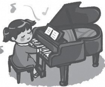
購入するピアノは子どもたちの発表会でも使用できる

議員 ピアノ更新に当たり、国産ピアノを含めた複数の選択肢の中から、スタインウェイ&サンズ社製のピアノを想定している理由と検討過程はどのようか。 総務部長 他団体でのピアノの導入状況や価格、耐用年数等の比較検討を行い、現在ではスタインウェイ&サンズ社製のブランドピアノD-274が全国の市民ホール等で数多く採用されていることから、音楽によるまちづくりを推進している本市の文化芸術の拠点にとってふさわしいピアノであるものと考え、購入を想定しているところである。 議員 市民に対してどのような説明をすることで、1台457万5000円もかけてピアノを購入することへの理解促進を図っていく考えか。 総務部長 スタインウェイ&サンズ社製のピアノは、高い音質と耐久性で広く知られており、演奏者からも多くの支持を受けている。 また、市民の福祉向上、文化芸術の振興等、市民会館の目的にも合致し、有用な物品の購入になるものと考えていることから、市民に対して機会を捉えて説明を行い、理解促進を図ってまいりたい。 市民体育館の空調設備について 議員 市民体育館は日常のスーツ施設であるだけでなく、災害時には避難所となる重要な施設である。市民体育館の空調設備はどのようにあるべきと考えているか。 議員 競技への影響を抑える方式を考慮するとともに、災害時の避難所に指定されていることから、動力供給の安定性、環境への配慮等の比較・検討を行い、最適な方式設置場所を検討し、導入すべきものと考えている。 議員 事業実施に当たり、事業計画はどのように検討され、事業費はどの程度になると想定しているのか。また、維持管理費についてはどのようか。 教育部長 事業費、維持管理費については、採用する方式により大きく異なることが想定されるため、今後、設計作業の中で精査・明示がなされてくるものと考えている。 議員 まずは庁内で協議し、ある程度詰めたものを予算計上するのが務めだと思う。計上してから考えるというのは予算が膨らむ。まずはアイデアを出し切るというのが大事。今後、生かしてもらいたい。 ほかに 「議員定数削減」について質問。