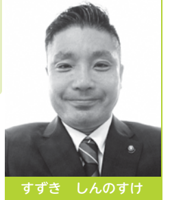
すずき しんのすけ