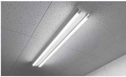
市内全ての小・中学校校舎及び体育館等の照明は順次LED化される(写真はイメージ)

議員 非常に高額な反則金もある中で、スケアード・ストレイトの教室の中で、違反行為を示しながら、反則金について説明を行う等、啓発に努めていただきたい。