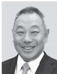
副議長 古川 歩