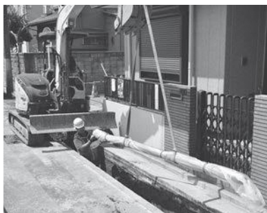
古い水道管の耐震化を図るため地震に強い管に更新

議員 誰もがルールを守り、安心して暮らせる「穏やかな蕨」を次世代に引き継ぐため、毅然とした実効性のある態度を強く求める。