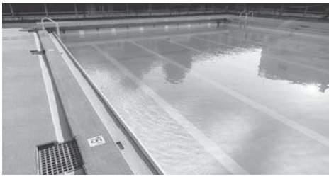
学校のプールはだんだん使用されなくなる（写真はイメージ）

議員 小学校の一部において、プール授業の民間委託が始まり、スポーツクラブでインストラクターが指導している。特に配慮が必要な児童についてなど、担任の先生との情報共有はどのようか。 教育部長 常時、学校とのやり取りも含め、打ち合わせをこまめに行っている。 議員 学校プールの跡地について、バスケットボールコートにするなどの先進事例がある。市としての考えは。 教育部長 今後も情報収集していきたい。 市内を流れる見沼代用水の今後は 議員 市内を北町から錦町に流れる見沼代用水の今後の見通しはどのようか。 都市整備部長 見沼代用水は、見沼代用水土地改良区が管理する用水路で、古くからかんがい用水として広く利用されてきたが、都市化が進み、本市と下流の戸田市では組合員がいなくなり、農業用水の役割を終えつつある。錦町側は土地区画整理において、水路の付け替えが予定されており、改良区と協議を進めている。 議員 市民から意見・苦情は。 都市整備部長 年に数件、水草の繁茂による流れの阻害、樹木の張り出しによる通行障害について市に情報が寄せられるが、改良区に申し入れるなど対応している。 議員 北町側にある桜の木の根の発達による道路の盛り上がりへの対応や、錦町側のヘドロ対策など、市民からの要望には適切に対応してほしい。 再開発後の蕨駅西口連絡所の見通しは 議員 令和7年度行政評価において、駅西口連絡所管理費は「その他見直し」となっているが、今後の見通しは。 総務部長 連絡所2階の化粧室については、開設より45年が経過し老朽化が著しく、駅西口再開発ビル内に化粧室の設置が見込まれることから廃止も含めた検討を行っている。 議員 耐震性はどのようか。 総務部長 新耐震基準以前の建物で耐震化も行っていない。 議員 化粧室の年間維持費は。 市民生活部長 令和6年度は約660万円を計上。 議員 駅西口再開発ビル内に化粧室ができれば必要なくなる。現在バリアフリーに全く配慮されていないので、新しい施設の化粧室には期待をする。建物に入っているシルバークリスタルやバス会社には丁寧な説明を行ってほしい。