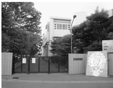
県立高校の中でも特に倍率の高い蕨高等学校

議員 ことし受験した中学3年生の数は、少子化の中で例年より増加し、公立高校無償化の影響もあり、厳しい高校入試になった。埼玉県ではさらに入試制度の変更があり、多くの生徒たちに混乱と悪影響を与えたと判断している。県公立後期合格率の結果をどう受け止めているか。