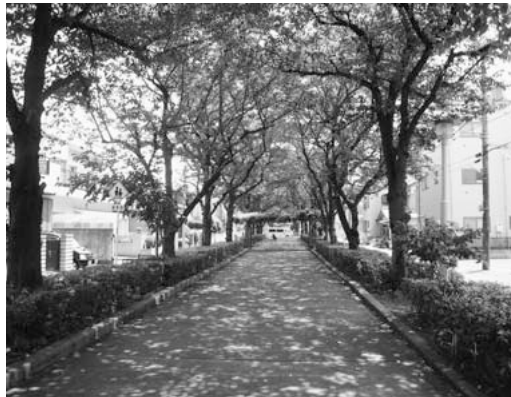
樹木の植え替えが望まれる南町桜並木

議員 短期的な計画や中・長期的な計画を適宜保存にかかわる方に開示していくことを要する。