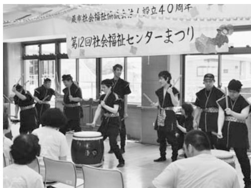
6月に開催された社会福祉センターまつり

議員 社会福祉センターのレインボー松原・ハート松原の現状の利用と定員拡充についてどのように考えているか。