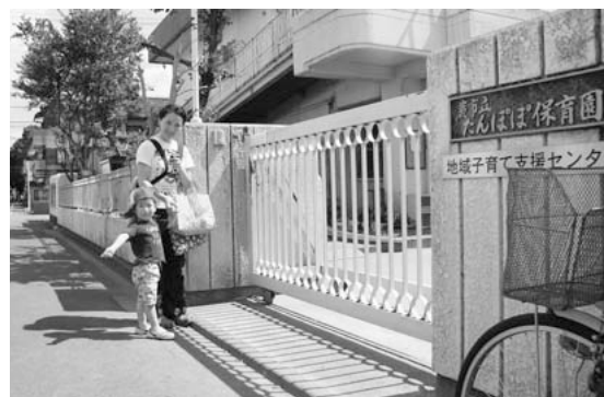
子どもが元気に通う保育園