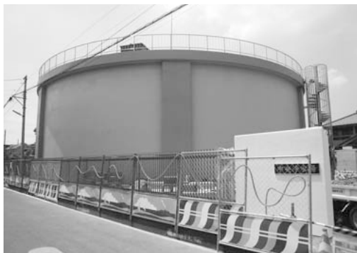
順調に進む中央浄水場改修工事