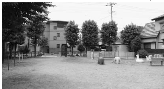
簡易トイレ設置が望まれる北町ふれあい公園

都市整備部長 隣接する住民は難色を示している。利用者の声も聞いていきたい。 ほかに 「小規模社会福祉施設の防火安全対策」について