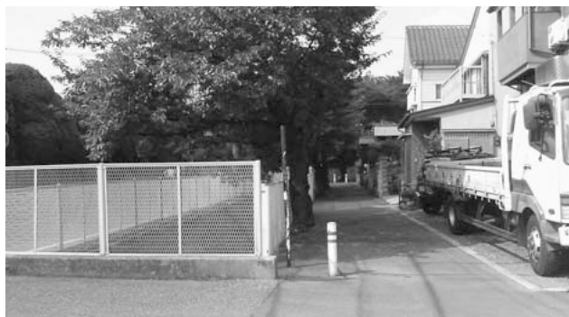
法律上の道路ではない見沼用水沿道は課題が多い(北町5丁目)

議員 沿道には数十台分の駐車場があり、車両が通行している。不必要な車止めを撤去し、近隣市民は通行できるようにできないか。 都市整備部長 本来車両通行できない所を様々な事情で通行している実態があるのはわかる。援助を要する家庭にとって、1日でも早い援助金の支給が望まれることは認識している。支払 議員 外国人の比率はどのようか。 市民生活部長 6月1日現在、外国人登録は3千638人。うち中国人55.2%、韓国人14.8%、フィリピン人10.5%となっている。 ほか 「敬老祝金と金婚式」について質問。