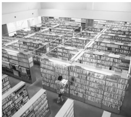
子ども読書活動推進計画の策定を！（市立図書館）

教育部長 平成21年3月に策定された第2次埼玉県子ども読書活動推進計画を基本にするとともに、地域の特徴を生かした本市独自の計画の策定