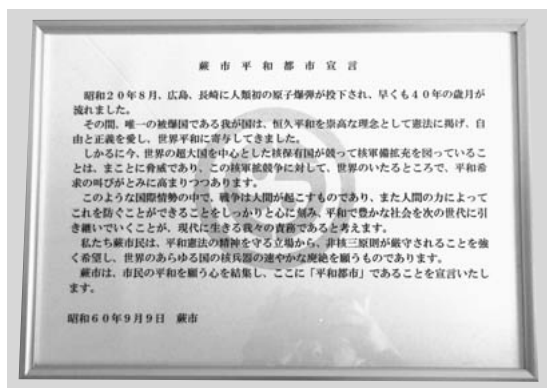
1985年に制定された藤市平和都市宣言

平和都市宣言塔の形状、材質、デザイン等の仕様は専門業者に確認を取りながらプランをまとめているところである。設置時期は9月9日を目標に準備を進めていく。