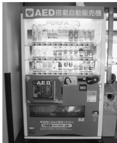
AEDマップの作成に期待！（AED搭載自動販売機）