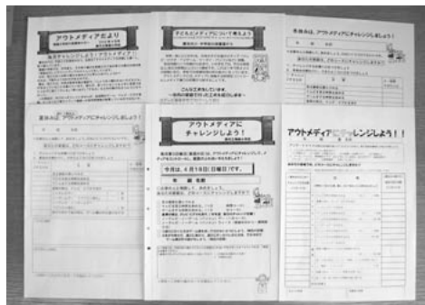
アウトメディアのチャレンジカード

毎に行う調査で、「テレビやゲームで遊ぶ」が、前回より減っている。ゲームの時間も「30分以内」が80%で、アウトメディア活動の成果がみられる。「蕨市は日本で画期的な地域だ」と、埼玉大学の野井准教授は評価されている。「メディアコントロールの日」の今後の具体的な取り組みについて伺いたい。