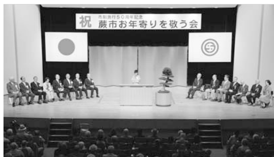
昨年度行われた蕨市お年寄りを敬う会

内の移動支援は原則として認めていないが、介助者がいなければ目的を果たせない場合は認めている。観劇やコンサートなど娯楽目的の施設では相応のサービス提供が受けられるものとし、支援の必要性がないと考えているが、一