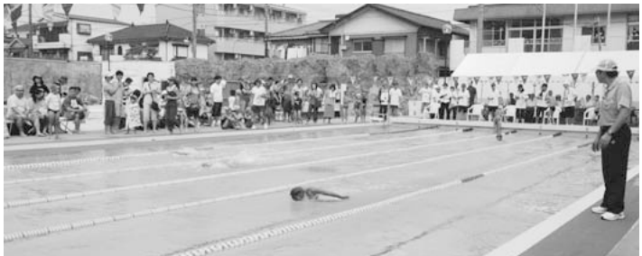
図書館や保育園との複合化を期待される中央プール