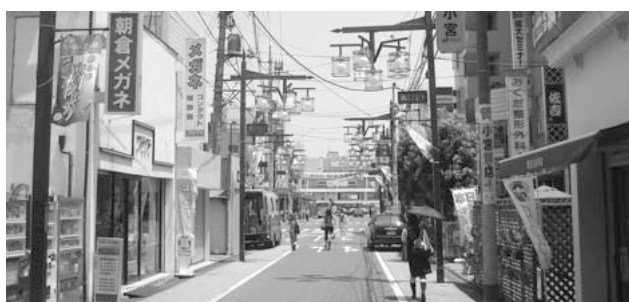
電気料助成の増額が望まれる街路灯（西口駅前通り）