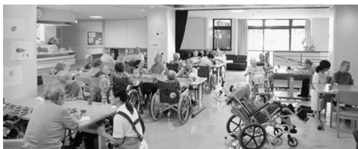
楽しく談話する特養ホーム「蕨サンクチュアリ」のみなさん