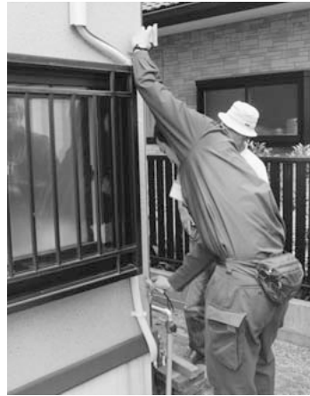
宮城県七ヶ浜町で被害建物の調査をする蕨市職員

議員 首都圏地震に備え、蕨市地域防災計画の充実が必要だ。 市民生活部長 大震災をふまえた国・県の改定をもとに、本市の計画を充実させる。