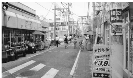
住民参加による魅力あるまちづくりに向けて

「ニティ活動を住民参加でまちづくりにいかす視点が一層必要と考える。市長の見解は。」