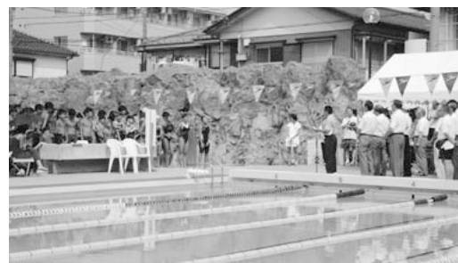
図書館や保育園との複合化も期待されるプール

総務部長 請願書が採択されたことの重みは認識している。プール施設が老朽化している