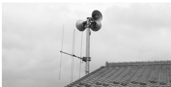
伝達の仕方に工夫が求められる防災無線