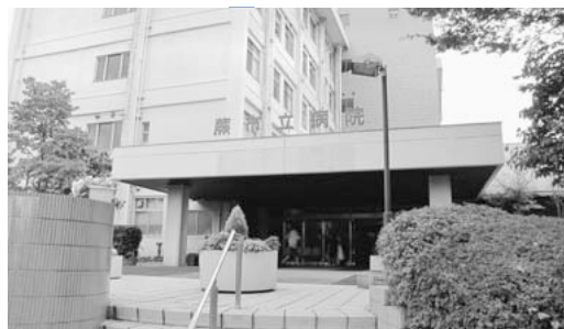
小児科・産科の充実が望まれる市立病院

病院長 産科と小児科の連携というものは、周産期医療を行う上で必須のものであり、そのレベルを上げなければいけないということが今後の課題である。具体的には、新生児対応の小児科医師の補充が必要であると考えている。これが達成されれば、ハイリスクの分娩も可能となり、分娩数はさらにふやせるものと考えている。