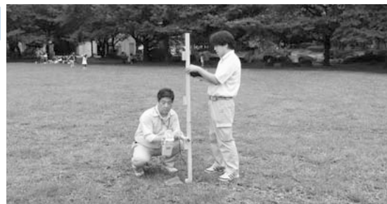
市内で放射線量の測定を実施 (市民公園)

ようになつており、市場に出回る野菜に関しては、安全確保はなされている。学校給食においても、食材の購入、管理から調理における衛生面でも細心の注意を持って取り組んでいく。