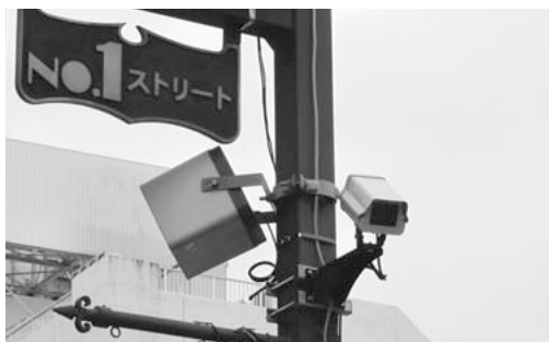
塚越商店会が設置している防犯カメラ

占める割合が高く、自転車盗の減少こそが犯罪抑止に向けた重点項目と位置づけ、取り組んでいる。内容としては、警備員2名が市内の大型スーパーや駅前等をパトロールしながら無施錠に対する注意札の張りつけ等の啓発を継続して実施する。