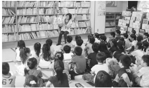
読書活動支援のさらなる充実を（中央東小：読み聞かせボランティア）

教育長 本市においても、学校ごとに年間の目標とする冊数を決め、全校朝読書等に取り組んでいるなど、児童・生徒の意欲を喚起している。また、達成した児童・生徒を表彰するなど、各校が創意工夫