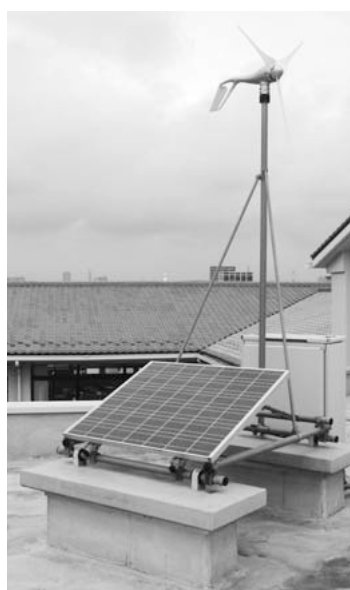
環境教育の一環として設置されているソーラーパネルと風力発電機（北小）