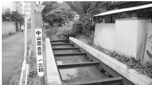
水の流れの改善が望まれる見沼代用水