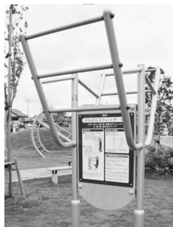
お年寄りの健康づくりの推進を（わらびりんご公園・健康遊具）

総務部長 近年の地震被害では非構造部材の落下、転倒による人身被害等が多く発生していることから、非構造部材等の耐震対策の必要性については認識している。非構造部材の耐震化については、各施設の判断によって行われているので、今後統一的な点検方法等を整理し、耐震化に向けて検討したいと考えている。