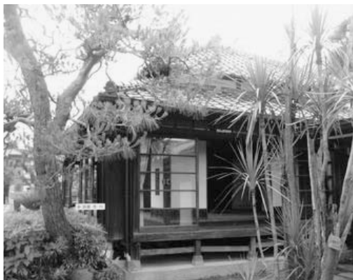
市内観光ルートの拠点として期待される歴史民俗資料館分館

いづくりを進める重要な施策であるので、拙速を注意し、慎重かつ確実な計画事業の推進を図っていきたいと考えている。