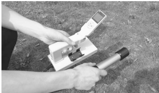
放射線測定器で市内をくまなくチェック

市長 大規模の災害になったときには、比較的離れた地域との協定が非常に有効なことは間違いないので、積極的に検討していきたい。