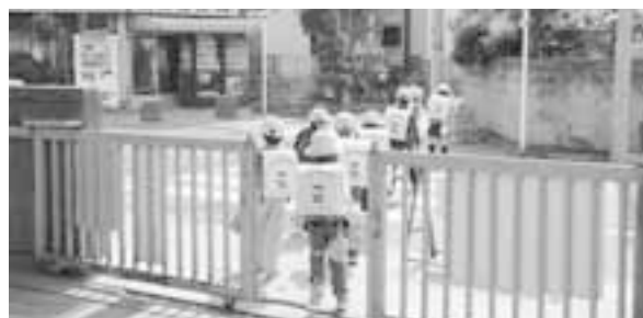
安全な通学路の整備を（塚越小学校の下校風景）