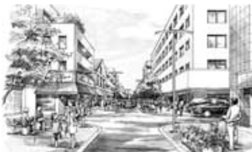
蕨駅前通り西口線の整備イメージ

議員 通り線及び中央南通り線の廃止、また新たにまちづくりのルールとして地区計画を都市計画決定していく予定であるが、地区計画については、原案に対する縦覧を2月に2週間行つたところである。今後、も県の整備、開発及び保全の方針の変更作業との調整を図りながら、関連する都市計画の変更手続きを進めたい。