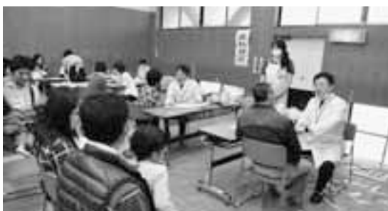
25年度は市民会館と中央公民館で実施される「歯ッピーわらび」

議員 制度廃止後は厳密にその学区の学校に入学してもらうという方向の理解でよいのか。