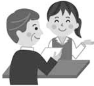
知的・身体・精神、3障害の窓口一元化を！