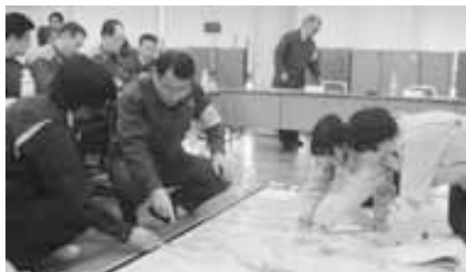
防災リーダー育成のために行われる災害図上訓練のイメージ

営訓練は、市内37の自主防災会からおおむね3名、計100名程度を対象として実施する。地域の中心となり、住民の防災意識向上を推し進める人材を育成するため、次年度以降も受講対象者を入れかえ、継続して実施する予定である。