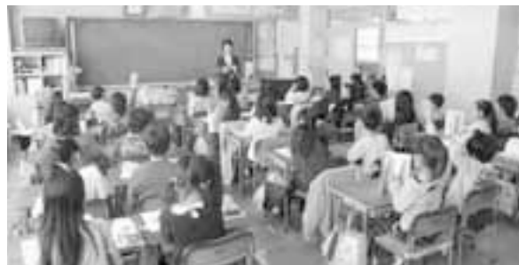
市独自の取り組みで魅力ある学校づくりを（西小学校）