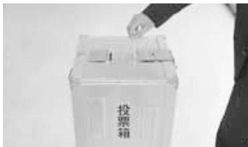
選挙制度の充実を求める

選挙管理委員会委員長 メリットとしては選挙人が1回で2つの選挙を同時に済ませることができ、選挙の執行経費の面でも節減を図ることができること等がある。デメリットとしては選挙人にとって市長と市議会議員のマニフェストが混在しやすいこと、一定期間に事務量が増加すること等がある。 議員 同時選挙だと、選挙が