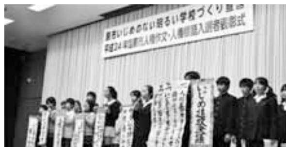
2月12日に「蕨市いじめのない明るい学校づくり宣言」が制定されました

切と認識している。一中「いじめ追放決議」など児童・生徒の主体的な取り組みを全市に広げるため、校長会等で紹介してきた。さらに、各校の発表の機会を設けるとともに、子どもたちの宣言ができればと考へ、制定に至った。