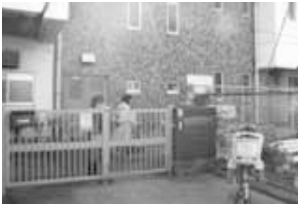
母子世帯や子育て世帯に影響の大きい生活保護基準引き下げには反対！