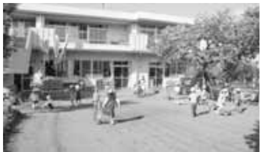
子育てしやすいまちづくりのために保育行政の充実を（くるみ保育園）

健康福祉部長 特別助成金の支給拡大は、ほかの待機児童対策の効果や経費も考慮しながら検討する必要がある。