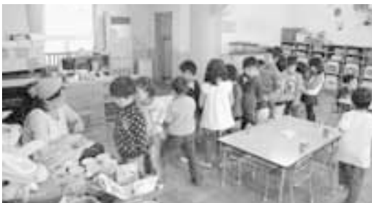
待機児童解消に向けて積極的な取り組みを（みどり保育園）