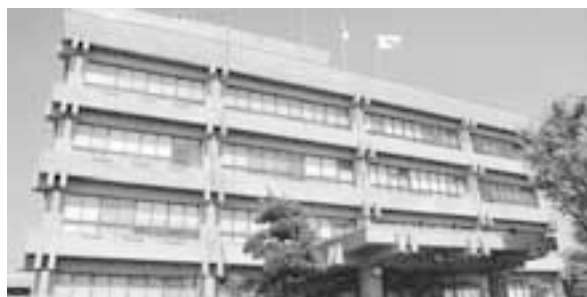
築48年経過し、老朽化が目立つ市役所庁舎

理事 現在、公共施設の耐震化を計画的に進めることがまずは重要な課題ととらえているので、今後も内部で議論を