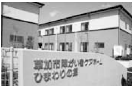
障がい者ケアホームとショートステイ施設（草加市ひまわりの郷）

議員 市有地を貸して、知的障がい者用グループホームとショートステイ2室を設置する計画だが、ショートステイはどの程度利用され、事業が成り立つためにはどのくらいの利用が必要と考えるか。 健康福祉部長 ほぼ空きがない程度利用があると考えている。グループホームとショートステイを合わせて事業を成り立たせると考えている。 議員 私が調べた6事業所の中にはショートステイの利用が少なく運営が厳しい事業所もある。状況によって市の