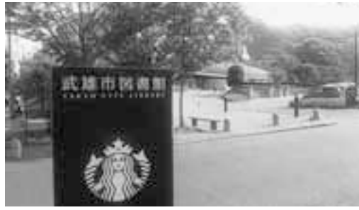
ツタヤが運営し、スターバックスも併設されている武雄市の図書館