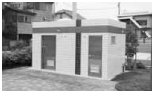
わらびりんご公園の立派なトイレ