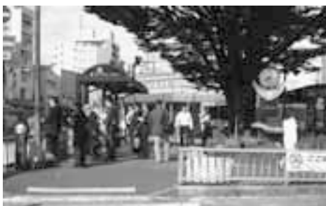
改善が求められる駅西口広場の喫煙場所

通行人の受動喫煙を減らす対策は重要なので、指定喫煙場所を他に移すことを検討していく。