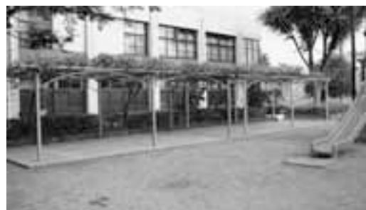
来年の開花が望まれる北町公園の藤棚

議員 北町公園等にある藤棚 の開花状況と今後の開花対策 はどうか。 都市整備部長 藤の花が咲か ない公園等も見受けられるの で、来年以降の開花を目指し 適切な時期の剪定、施肥など 管理方法等について検討する。