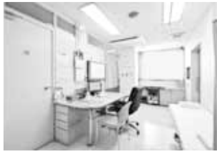
子宮頸がんワクチンは本当に安全か

議員 6月14日の厚労省の会議で「積極的な勧奨はしないが、定期接種は継続」となったが、千葉県野田市では市内40医療機関にストップをかけたのは知っているか。