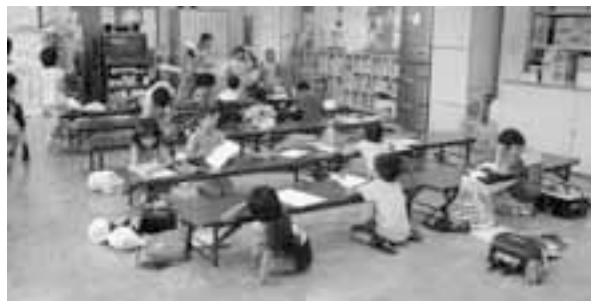
年末年始の開室日が拡大（写真は中央留守家庭児童指導室）

災害等や交通機関の混乱等の際に、児童の安全確保が困難な状況が生ずる恐れがあるため判断した。県の事業等を活用し夏季休暇中の生活にメリハリをつける工夫をしたい。 議員 児童がとても楽しみにしてきた取り組みであり、引き続き、夏休みの思い出となるような対応を求める。 ほかに 「中学校でのクラス編制」と「車路付跨線人道橋の照明の改善」について質問。