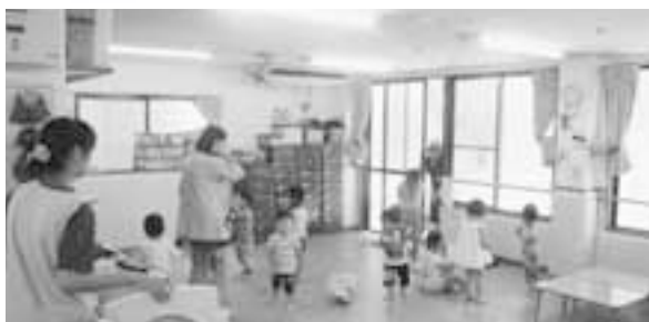
待機児童対策として家庭保育室保育料の助成拡大を（写真はひまわり保育園）