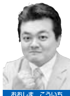
おおしま こういち

れている大荒田交通公園には建物や備蓄が整っていない。避難場所の変更もしくは建物や備蓄の対応が必要と考えるが、市の見解はどのようなか。また、他の避難所については同様の箇所はないか。