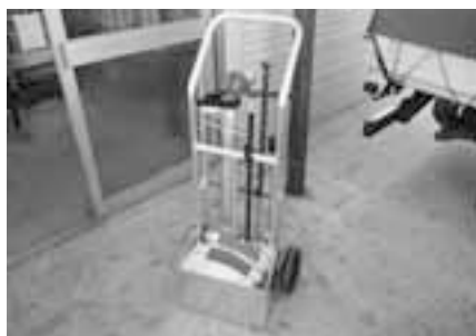
火災時に消火栓を使用した初期消火等ができるスタンドパイプ

いか。また、災害時には応急給水にも活用できるスタンドパイプの自主防災会支給助成はできないか。