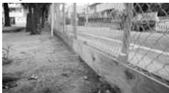
改修された三和公園の土留め

議員 三和公園の土砂を外に出さないための土留めが老朽化しているため、雨の時には近隣へ土砂が排出され、住民からの苦情を聞いている。土留めの補修を検討できないか。