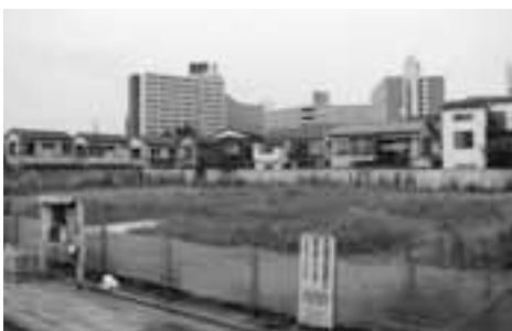
今年度中に工事が完了する公園地下の雨水調整池（写真はわらび公園）

議員 北町1丁目雨水調整池築造工事の進捗状況と完了見込みはどのようなか。 都市整備部長 躯体工事とポンプ施設工事は既に完了しており、今年度、最後の工事として、調整池への導水及び調整池からの排水のための管路施設工事を予定している。 議員 合流式下水道緊急改善事業における南町ポンプ場高速ろ過施設設置工事の進捗状況と完了見込みはどのようなか。 都市整備部長 躯体工事を設置する土木工事は既に完了しており、今年度は前年度に引