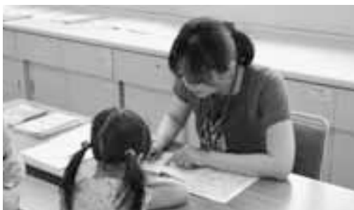
市民の健康増進に向けて活躍する保健師（写真は3歳児健診）

議員 保健師は乳幼児や妊婦、成人、高齢者など幅広い年齢層を対象にし、身近な保健・福祉サービスを担っている。近年では児童虐待や男女共同参画、職員のメンタルヘルス教育などの活動が行われており、保健、医療、福祉の橋渡しの役割を担う市町村保健師の活動が期待されている。本市の保健師の正規職員、嘱託職員の割合をお聞きたい。 健康福祉部長 正規職員は保健センターに9名、介護保険室に2名、教育委員会に1名。事務補助員は保健センターに1名、保育園に2名の計15名が配属されており、正規職員の割合は80%となっている。 議員 保健センターの保健師の業務の現状はどのようなか。 健康福祉部長 母子保健、成人保健、精神保健、精神障害者福祉、また医療保険課からの委託による特定保健指導の業務を行っている。今年度は新たに健康アップ計画の推進会議やモデル地区事業、県か