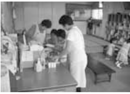
パートの指導員の努力で運営されている留守家庭児童指導室

議員 今年度から報酬比例部分の年金支給が61歳からになり、今後、支給開始年齢が段階的に引き上がって65歳支給になる。退職と年金支給までの間が無収入にならないように、①希望者全員を再任用すること、②短時間勤務も受け入れること、③消防職員を再任用するために受け入れる職種を広げる検討を行うこと、が必要だと思いがどうか。