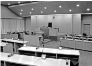
いよいよ議会中継が始まります!! (詳細は12ページをご参照ください)

最後に「予算常任委員会等の設置等」については、既存の決算常任委員会とは別に予算常任委員会を設置すべきとの意見で一致しましたが、委員会の形態や審査方法等の細部については委員間で意見の隔たりがあり、委員会としての結論には至りませんでした。