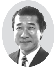
副議長 三輪かずよし