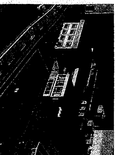
夜間中学完成予想図

日本共産党は埼玉県内に夜間中学を作るよう国政や県政、市政でも様々な機会を長年要望を続けてきました。4年前に川口市に1校も埼玉県には3万4千人、さいたま市に4千人余りの未就学・未終了者がいるとの結果があります。「埼玉に夜間中学を作る会」では2校目をさいたま市にと活動をしていきます。