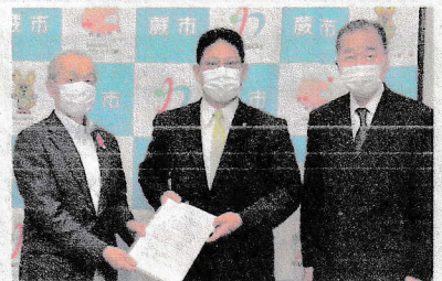
2021年11月、予算要望書を市長へ提出