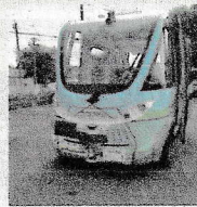
茨城県境町での現地調査を実施

回答 有人での実証実験は、無人での自立自動運転実現への第一段階として一定の有益性はある。